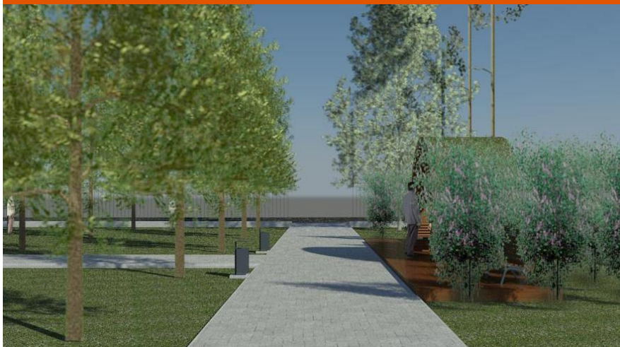
Дорожка от стадиона к ул. Советская.