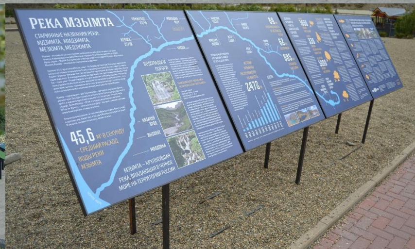
Пример оформления информационного стенда

Со стороны рынка и со стороны прилегающего жилого дома устраивается деревянный забор с металлическими стойками. Вдоль забора высаживается живая изгородь. Около входа в сквер со стороны рынка располагается альпийская горка общей площадью около 120 м 2 . Перед альпийской горкой располагаются информационные стенды с полезной и увлекательной информацией, интересными фактами о районе: его истории, флоре, фауне, основных реках, горных хребтах и т.д.