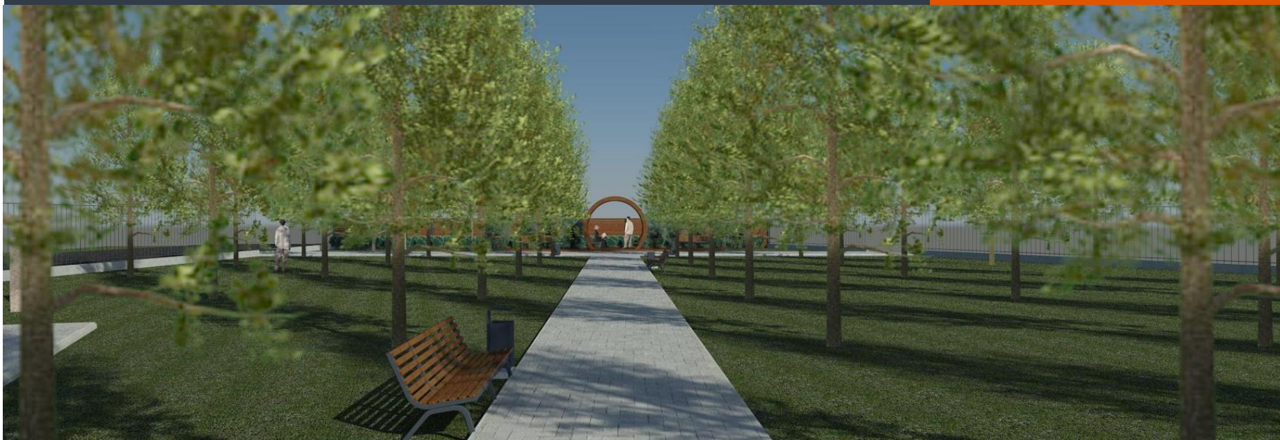
От существующей площадки к беседке.